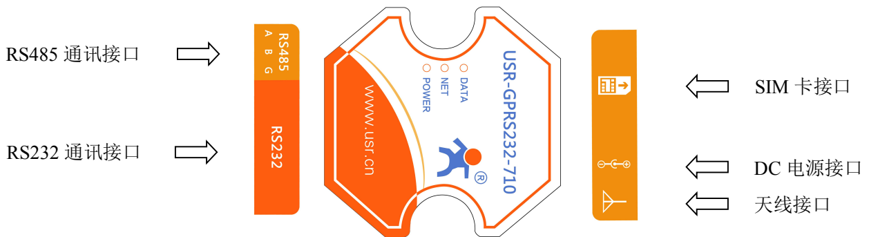
图 1 USR-GPRS232-710 接口图

USR-GPRS232-710 有一个电源接口, 一个 RS232 通讯接口, 一个 RS485 通讯接口, 还有 SIM 卡接口, 天线接口, 具体位置如下图所示: