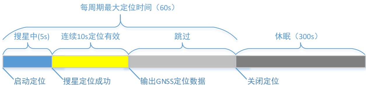
周期模式定位成功流程