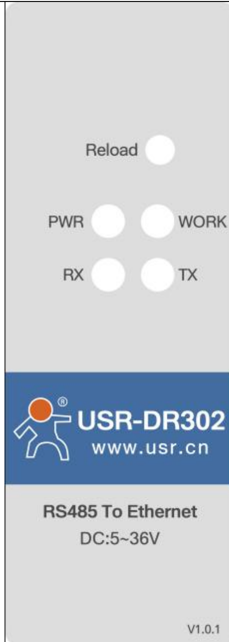
图 2 USR-DR302 串口服务器指示灯和 Reload 说明