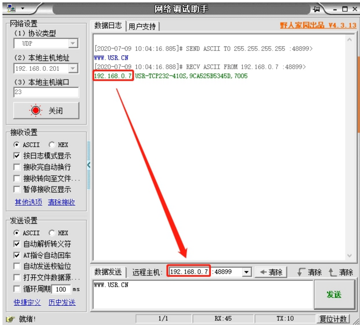
图 2 已进入网络 AT 模式

此时表明模块已经进入网络 AT 指令模式，如果挂载多个设备，使用广播会有多个设备同时回应，此时只需要修改远程主机 IP，与自己的设备 IP 保持一致。