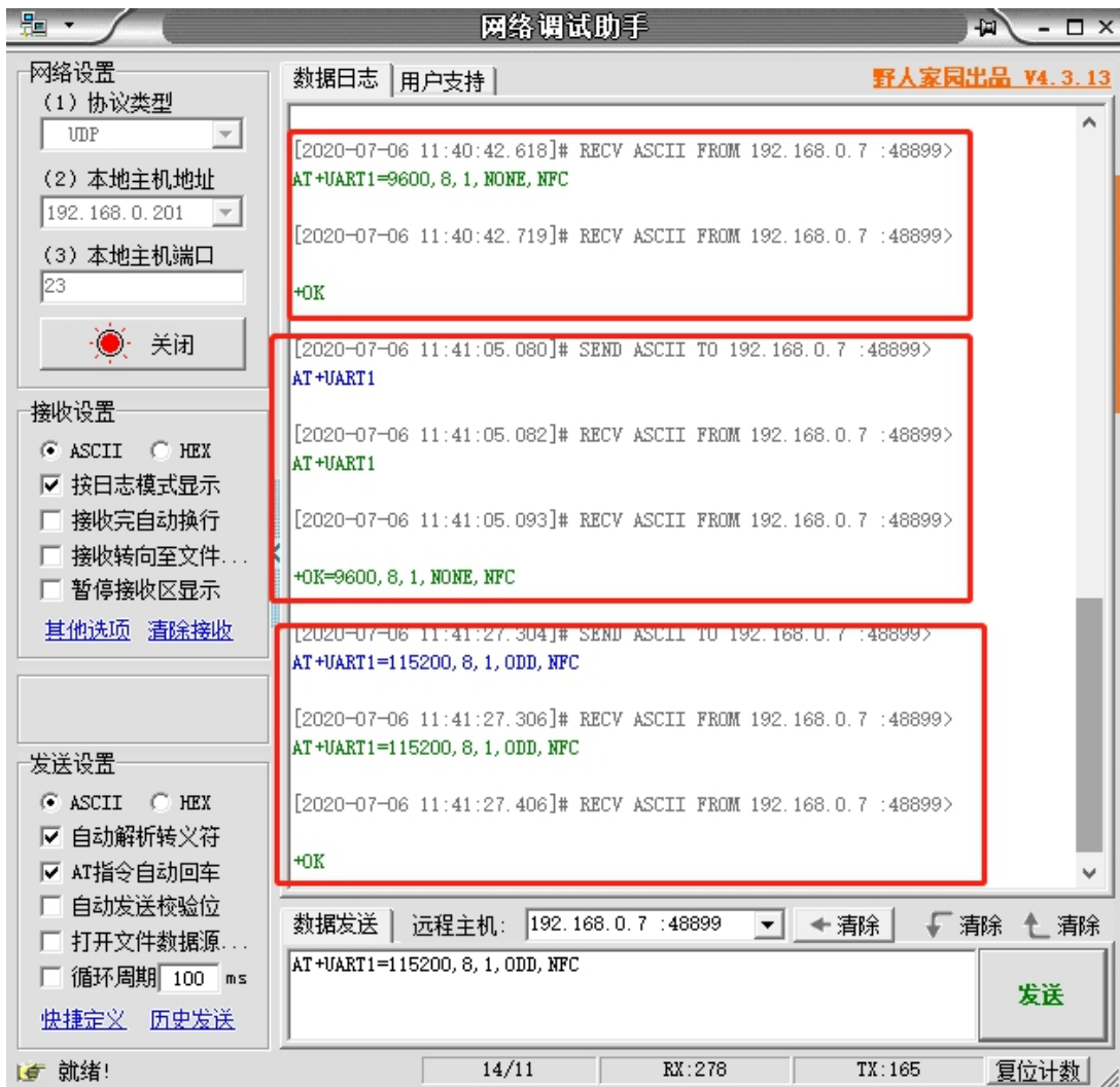
图 3 网络 AT 指令设置和查询