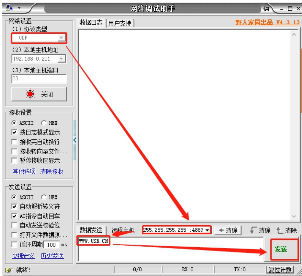
图 1 准备进入网络 AT 模式

通过网口 UDP 广播发送向端口 48899(远程主机设置为 255.255.255.255:48899)发送 WWW.USR.CN ，如果模块和电脑在同一网段内，则会收到模块回复的信息。