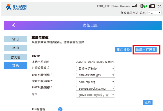
图9 恢复出厂设置页面